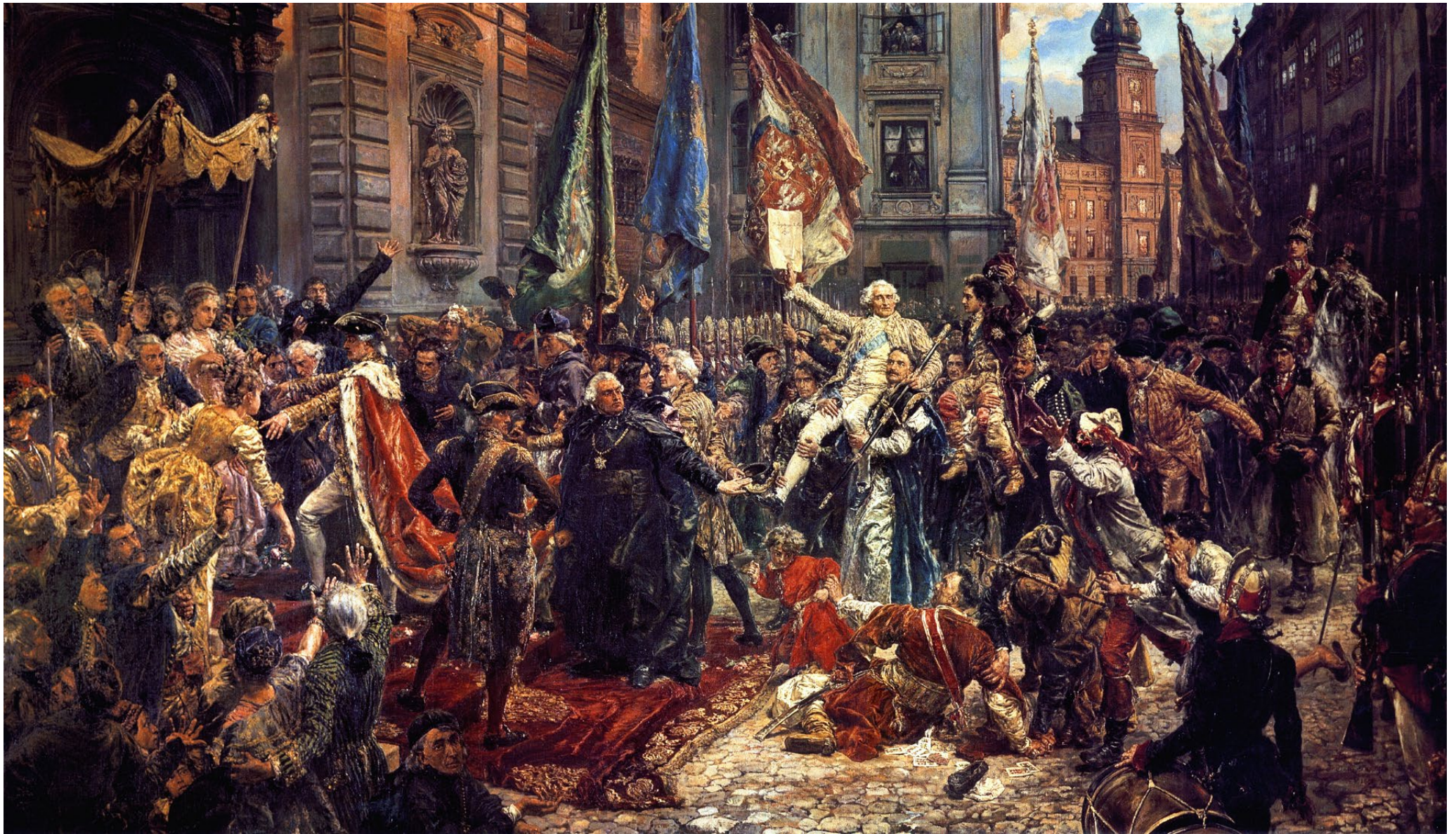
Konstytucja 3 Maja 1791 roku – obraz Jana Matejki wykonany w 1891 r. Jest artystyczną interpretacją momentu po uchwaleniu konstytucji.