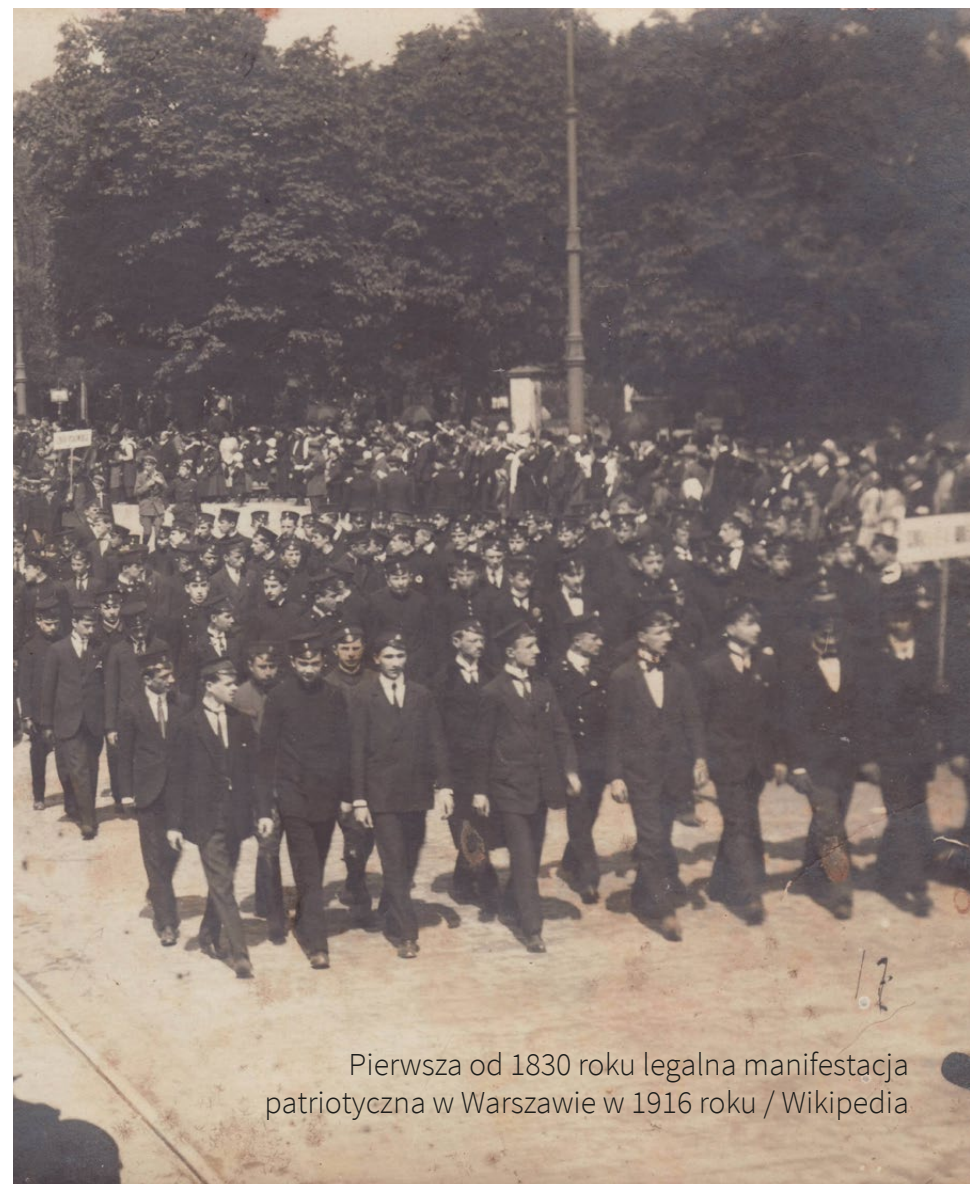
Pierwsza od 1830 roku legalna manifestacja patriotyczna w Warszawie w 1916 roku

Konstytucja 3 maja stała się symbolem dążenia do niepodległości, refleksji i chęci naprawy państwa , do którego Polacy odnosili się w czasach zaborów. Została uchwalona zbyt późno, by uratować Polskę przed utratą niepodległości, jednak była mądrą i nowoczesną formą naprawy wadliwego ustroju, a zarazem drugą (po amerykańskiej) spisaną konstytucją na świecie.