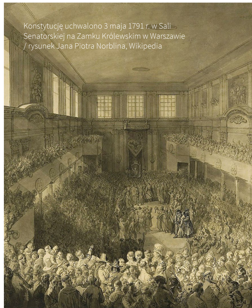
Konstytucję uchwalono 3 maja 1791 r. w Sali Senatorskiej na Zamku Królewskim w Warszawie / rysunek Jana Piotra Norblina, Wikipedia

Nie da się ukryć, że Konstytucja została uchwalona nie do końca legalnie . Uznano, że ważniejsze niż zachowanie parlamentarnych procedur jest przegłosowanie reform. Dokonano tego podczas skonfederowanego Sejmu Wielkiego (nie obowiązywało liberum veto , by – jak zazwyczaj – głosowania nie zablokował przekupiony poseł), w asyście wojska, pod presją tłumów. Termin obrad przyspieszono, by przeciwnicy zmian nie dotarli na czas.