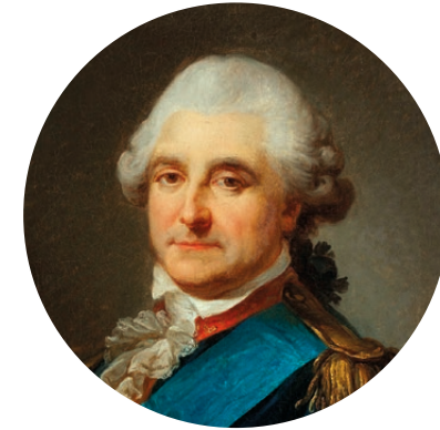
STANISŁAW AUGUST PONIATOWSKI

Wkład Stanisława Augusta Poniatowskiego w Konstytucję wciąż jest przedmiotem sporów. Był królem podporządkowanym Rosji, chętnym do reform w granicach, które tolerowała caryca Katarzyna II. Brał udział w tworzeniu i uchwaleniu Konstytucji, lecz gdy następnie do Polski wkroczyła rosyjska armia, przystąpił do konfederacji targowickiej, a ostatecznie zalegalizował III rozbiór Polski.